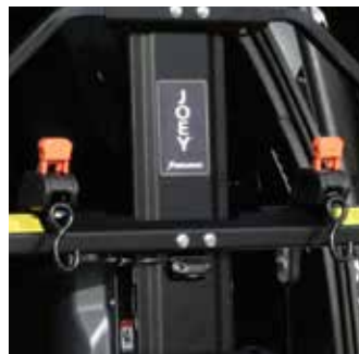
El kit de la correa * incluye dos Correas de sujeción retráctiles Para mayor tranquilidad. *Requerido en algunos vehículos