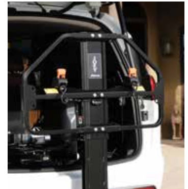
Barrera de seguridad exclusiva de la industria. Protegido por la Patente de Utilidad de los EE.UU. No. 403.615