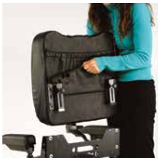
El Back-Off retira fácilmente la parte posterior del dispositivo de movilidad para que quepa en aberturas más reducidas de vehículos.