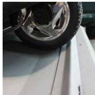
Se requiere un juego de calzos para FWD powerchairs.