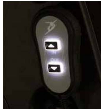
Un botón de control con luz indicadora.